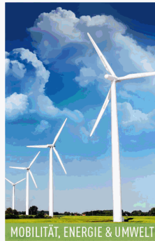
MOBILITÄT, ENERGIE &amp; UMWELT