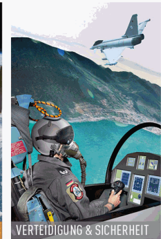
VERTEIDIGUNG &amp; SICHERHEIT

Wir sind eine eng vernetzte Unternehmensgruppe und bieten integrierte zukunftsorientierte Lösungen in den Branchen Automotive • InfoKom • Mobilität, Energie & Umwelt • Luftfahrt • Raumfahrt • Verteidigung & Sicherheit. Wir verstehen die Anforderungen unserer Kunden. Wir beraten unabhängig und kompetent. Wir realisieren effektiv, effizient und zielgerichtet. Wir betreiben zuverlässig und nachhaltig. Unsere internationale Marktpräsenz und unser Erfolg basieren auf technologischer Spitzenkompetenz und einem fairen Verhältnis zu unseren Kunden und Geschäftspartnern.